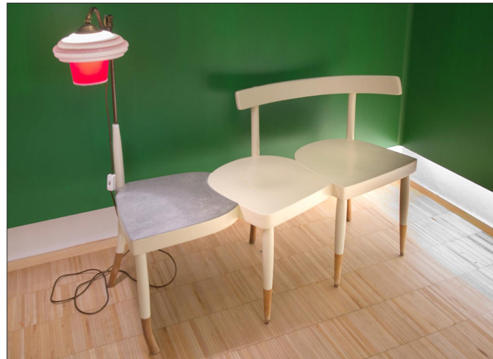
„Dreierensemble mit Lampe“, Frankfurter Küchenstühle (Stalker Stuhl), Buchenholz, Eternitplatte und Lampenschirm

Friedrich Rücker schafft seit vier Jahren Sitzmöbel aus älteren Designstücken, die er gekonnt zusammenbaut, oft so, dass sich die Teile gegenseitig stützen, zu einem anderen Stuhl oder einer Bank werden. Es sind humorvolle Kombinationen, die einen neuen Zweck bekommen, nicht nur zum Sitzen. Wichtig ist dem Künstler, dafür originale Design-Klassiker, ausgediente oder beschädigte Möbel zu verwenden, die jedoch immer eine Vergangenheit als etwas Besonderes hatten, keine Massenware kommt zum Einsatz.