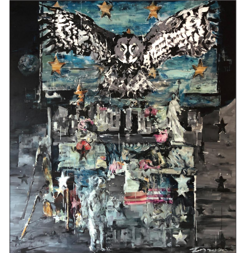
„Dämmerungserwachen, Vereinigte Staaten“, 2020, Öl auf Leinwand, 183 x 160 cm

Wang Jixin stellt Leinwandbilder aus drei verschiedenen Serien, die seit 2006 entstanden sind, aus. Der Künstler setzt sich in seinen Arbeiten intensiv mit den wirtschaftlichen und sozialen Umbrüchen unserer Gesellschaft und der Architektur auseinander. Die früheren Gemälde dokumentieren und interpretieren den Verfall eines chinesischen Porzellanentrums; 2019 entstand die Serie „Im Fluss“ über den Salzabbau in Hallein; seit August hat der Maler in den Räumen in der Imbergstraße farbin intensive Bilder zu verschiedenen Ländern geschaffen. Jetzt entstehen vielleicht Malereien auf Papier und Leinwand über Bad Gastein und ein Einblick in einige leerstehende Gebäude dort.